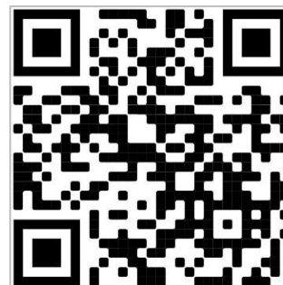
QR-Code zur Einfügung der URL